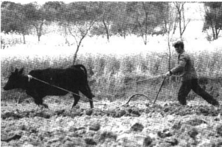
4月4日，地处桂相边界的广西桂林全州县两河乡农民在犁地。桂林的农民以农业结构调整为主线，抓紧春耕好时节，掀起了春耕生产的热潮。

初高中毕业生中，推出绿色证书最佳人群。绿色证书工程即是让回乡青年参加农业部门或职业学校组织的农林畜牧和信息等方面的实用培训，经过一定的学习并考试合格后，颁发相关培训内容的合格证书。