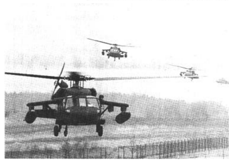
这是一架美军UH-60“黑鹰”直升机的资料照片。美国五角大楼官员2日证实，一架美军“黑鹰”直升机当天在伊拉克南部卡尔巴拉地区附近被击落，机上11名乘员中有7人死亡。

据新华社北京4月4日电 综合新华社驻外记者报道：美英联军3日加紧从南部战场向巴格达推进，并称已抵达距巴格达10公里处。当天夜间，巴格达再次遭到空袭，市内大部分地区供电中断。有报道称，经过两小时的炮火袭击，美军“部分”控制了巴格达的萨达姆国际机场，但此消息迄今尚未得到伊官方证实。