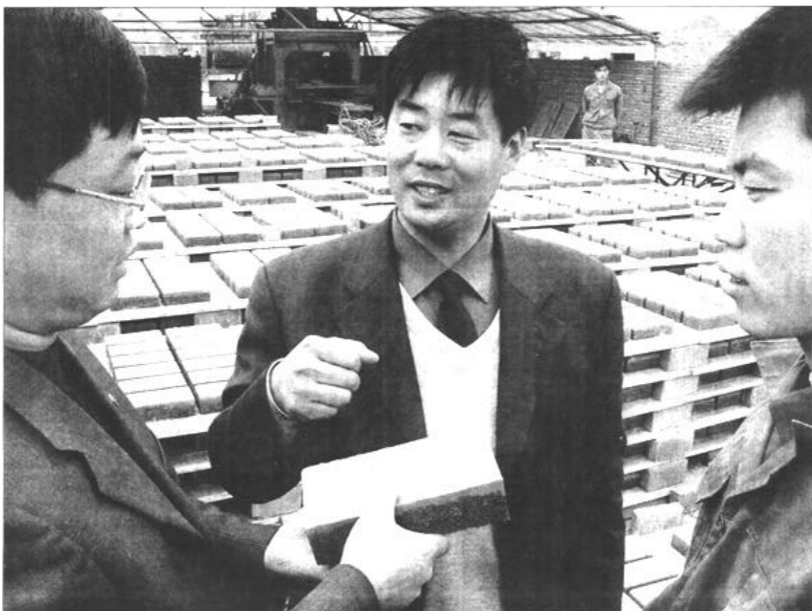
辛店街道的招商项目——东营富德新型建材有限公司是寿光客商马树松投资1000万元兴建的。利用油田电厂的废粉煤灰为原料，采用加气切割等新技术，产品具有质地轻、保温、隔热、防火、耐久性强等特点，是目前代替传统黏土砖、空心砖的理想建材，市场前景广阔。年生产加气混凝土砌块10万立方米。目前已试产成功。