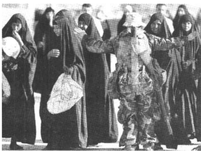
4月3日，一些伊拉克妇女在纳西里耶的一个美军检查站被拦住接受检查。

伊拉克问题上的立场没有也不会改变。约旦坚决反对对伊拉克的侵略，决不充当打击伊拉克的炮架，也决不允许外国军队使用其领土打击伊拉克。阿尔及利亚国务部长兼外交部长贝勒哈代姆2日谴责美英对伊拉克的侵略战争，并说这场战争“在国际关系史上开创了一个极其严重的先例”。