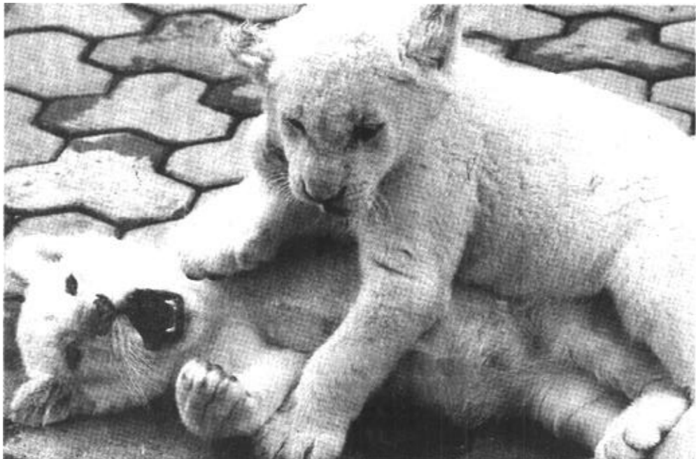
两只2002年底在广州市香江野生动物园繁殖出生的小虎在玩耍。

据新华社北京4月1日电 据《农民日报》报道，稻草、粪肥则成了种植食用菌专业户的宝贝。据介绍，稻草和粪肥通过石灰成了闽北山区不少农民发财致富的一大宝贵资源。