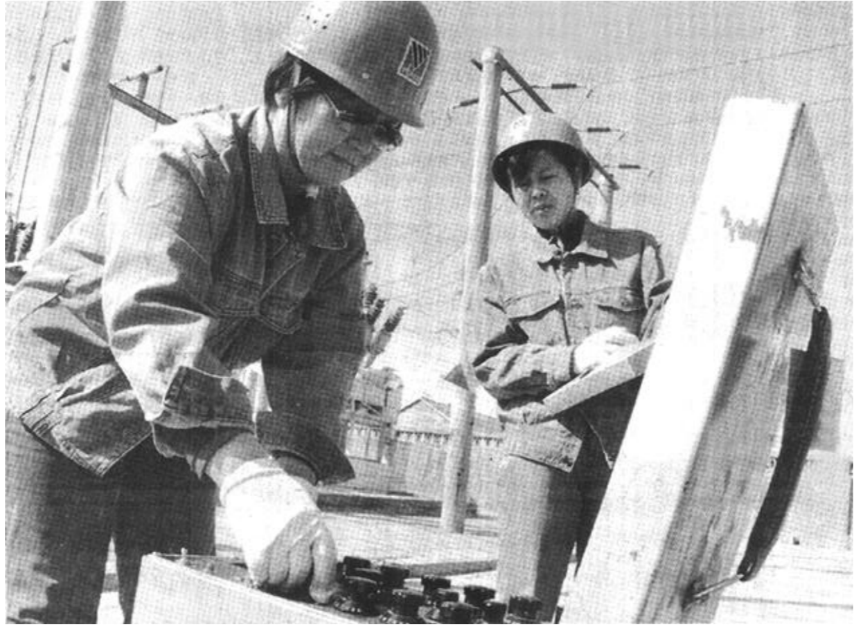
垦利县供电公司针对全县经济发展不断增强、用电负荷不断加大的实际，积极更新设备，提高电网科技含量和电网运作水平，为全县工农业用电提供了可靠的电力保障。

立足源头治理，严格环保执法，加大执法检查力度，清除治理污染源。该县每年底都要对全县企业进行“拉网式”检查，对没有环保审批手续的进行补办。